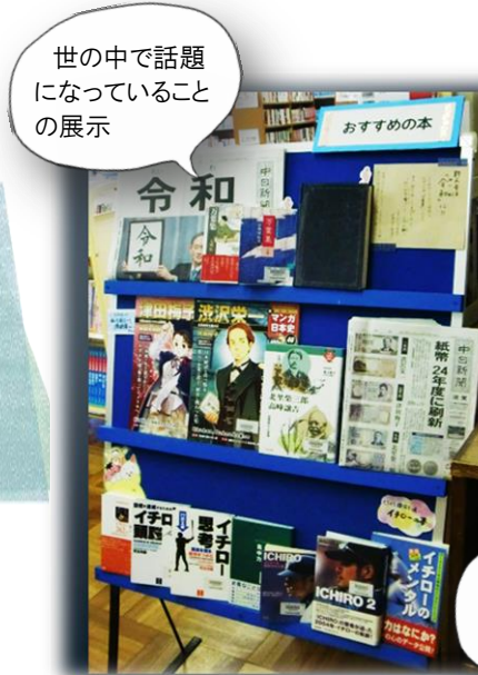
世の中で話題になっていることの展示