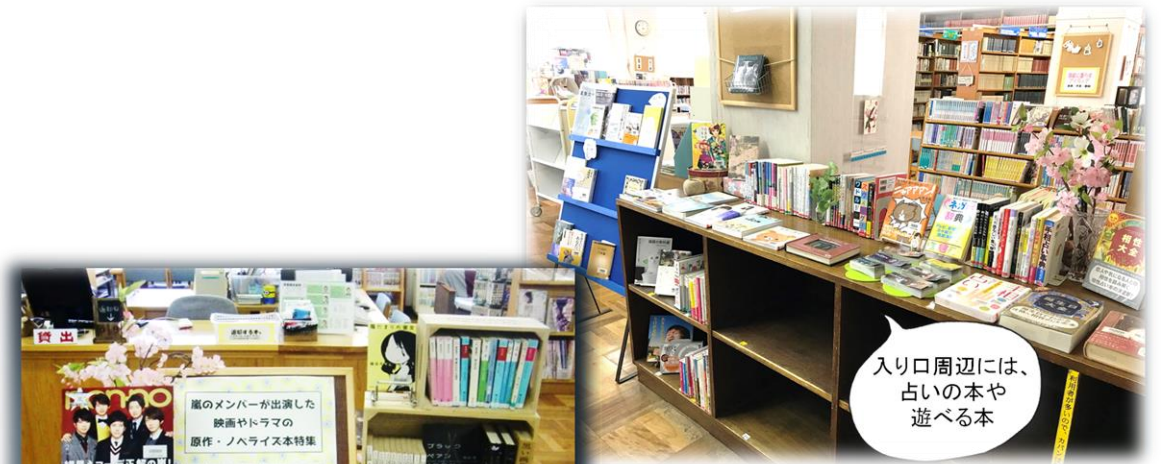
入り口周辺には、古い本や遊べる本

「読書の時間」の前には図書館新聞でおすすめ本を紹介。館内にも図書委員のおすすめ本や、十代が主人公の本、部活に関する本など身近なテーマで展示を随時変更し、楽しい読書活動の支援を行っています。