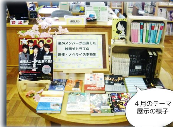
4月のテーマ展示の様子