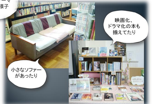
映画化、ドラマ化の本も揃えてたり