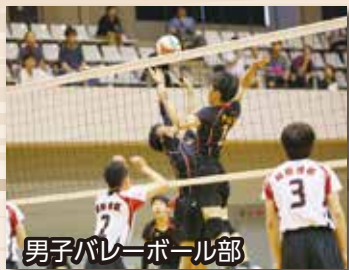
男子バレーボール部