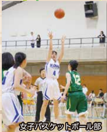
女子バスケットボール部