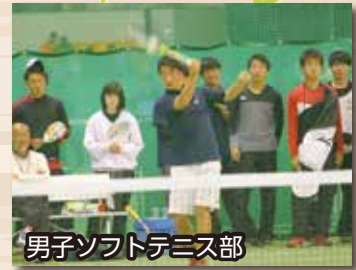
男子ソフトテニス部