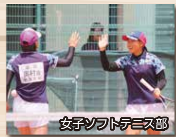
女子ソフトテニス部