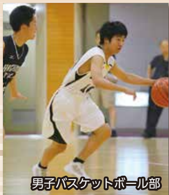
男子バスケットボール部