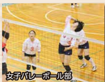
女子バレーボール部